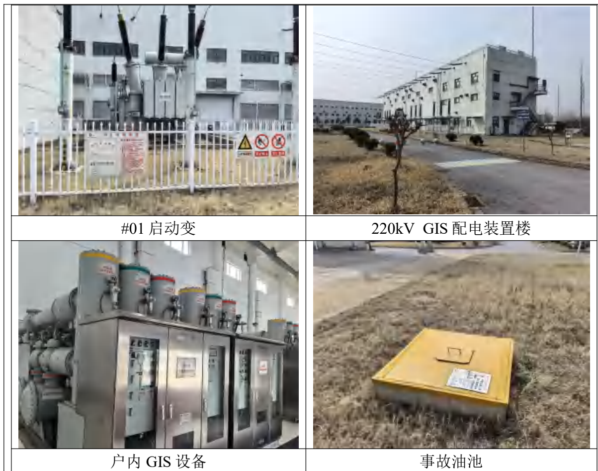
图 4-1 升压站照片