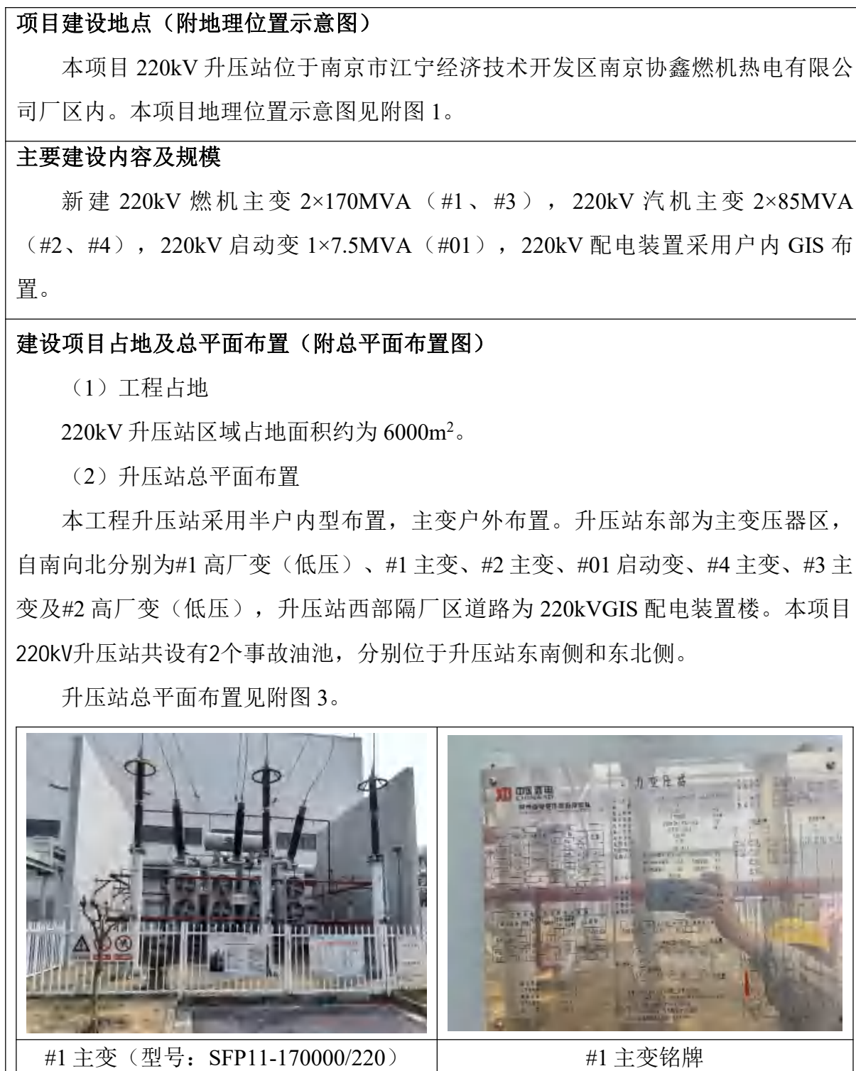
表 4 建设项目概况