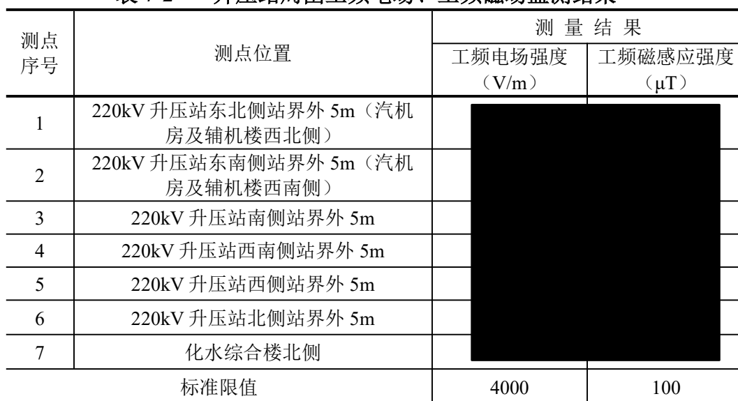
表 7-2 升压站周围工频电场、工频磁场监测结果