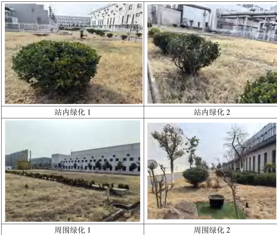
图 8-1 升压站内及周围绿化及硬化现状

经现场踏勘，220kV 升压站临时施工场地及站内外均已进行了地面硬化和绿化，运行期不会产生水土流失等生态环境问题，因此本工程运行期对生态环境的影响较小。升压站内及周围绿化及硬化现状见图 8-1。